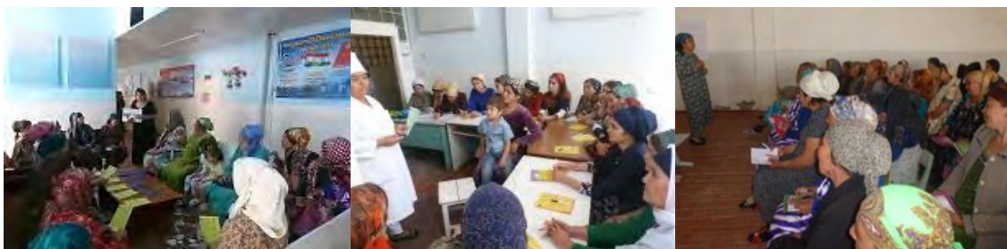
Рисунок 3. Информационные сессии

За отчетный период проведено 7 информационных сессий с участием 151 женщины, вернувшихся из трудовой миграции на тему сексуального и репродуктивного здоровья и планирования семьи. Занятия были проведены приглашенным специалистом Центра репродуктивного здоровья города Курган-тюбе.