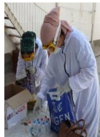
На фото: Процесс подготовки распределения дезинфицирующих средств для ЛЖВ, Представительство РОО «Афиф» в Хатлонской области.