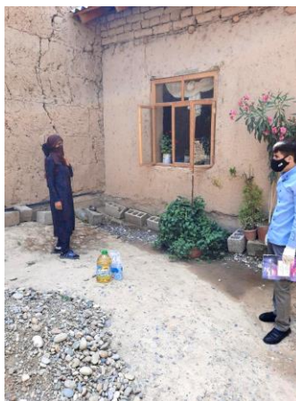
На фото: Процесс проведения консультирования по вопросам профилактики COVID-19 и передача продуктов питания, ОО «СВОН Плюс».