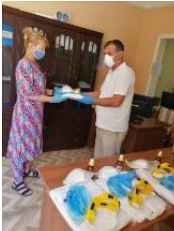
На фото: Процесс передачи средств индивидуальной защиты для аутрич-работников, ОО «Амали нек».